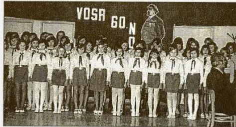
Az iskola énekkara