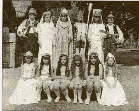
A Dalos Peti c. színdarab

A tanulók szabad idejükben több érdekkört látogattak. Az iskolán pezsgő kultúrelvet folyt (tánckör, énekkar, színjátékszökör).