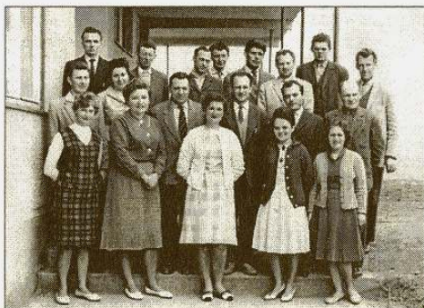
Az iskola tantestülete 1963-ban

A pedagógusok aktív osztályon – és iskolán kívüli tevékenységet fejtettek ki. Ennek bizonyítéka a bemutatott színdarabok: 1961-ben Az ajándék, 1962-ben