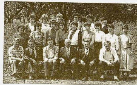
A tantestület 1990-ben

Az iskola baráti kapcsolatot létesített a Hontianske Moravcei, illetve a Nemecká nad Hronom-i szlovák tannyelvű iskolákkal. Az utóbbi iskolával még jelenleg is eleven a kapcsolat, ami főleg a nyelvi tábor, az úszó- és sítanfolyam közös megszervezésében nyilvánul meg.