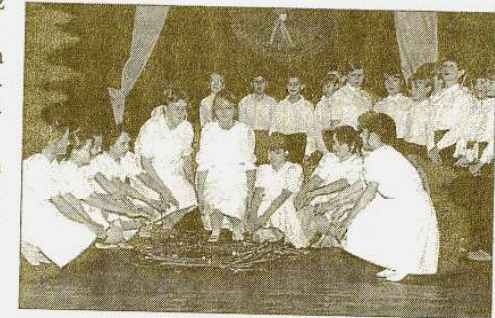
1990 – Szentiváni tűzugrás