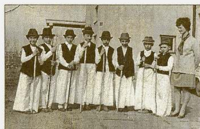
1970 - Kanásztánc