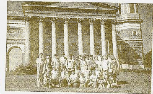
A honismereti tábor résztvevői Esztergomban