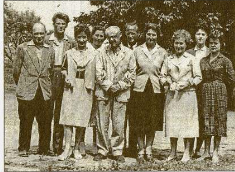
Az 1959/60-as tanév tantesülete

Ennek bizonyítéka pl. az 1958/59-es tanévben bemutatott HÓFEHÉRKE c. színmű,