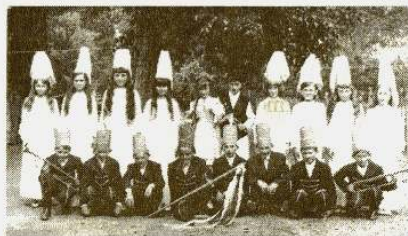
1970 – János vitéz és Iluska a tündérek és huszárok körében