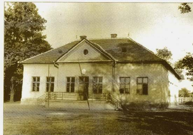
A régi iskola épülete