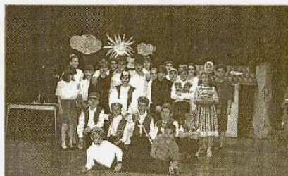
1998 – a Lúdas Matyi c. mesejáték szereplői

Ha élet zengi be az iskolát, Az élet is derűs iskola lesz.