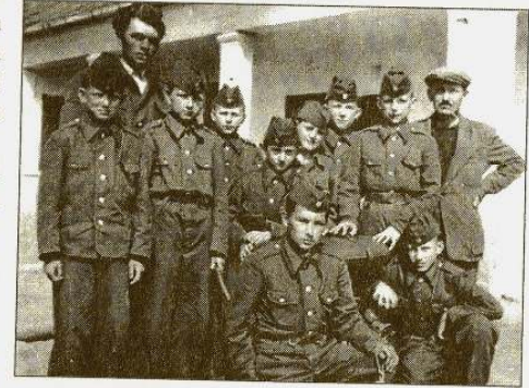
A felső tagozatos tanulók a tűzoltóversenyen

Az első tíz év pedagógusai voltak azok, akik minden probléma és nehézség ellenére – lelkes munkájukkal – lerakták a későbbi jó eredmények eléréséhez szükséges alapokat.