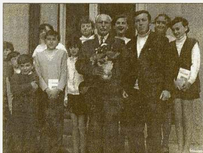
Beszélgetés Csontos Vilmos költővel