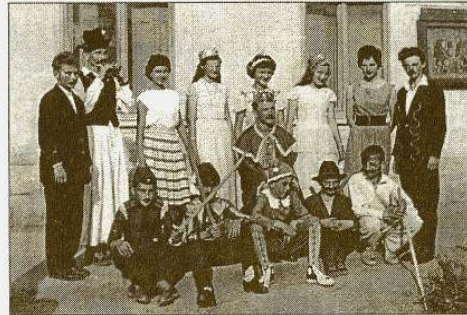
A Jávorfácska c. mesejáték szereplői